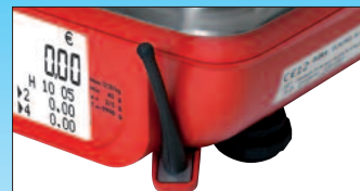
Radio frequenza wireless