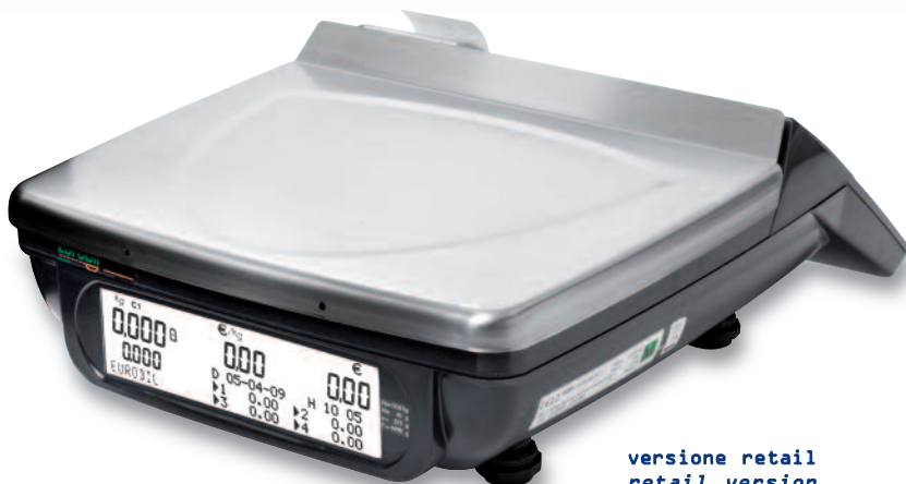
versione retail retail version